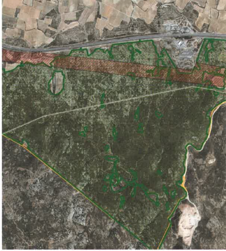
Figure 4 : Illustration sur vue aérienne de la modification proposée au sein de l'EBC