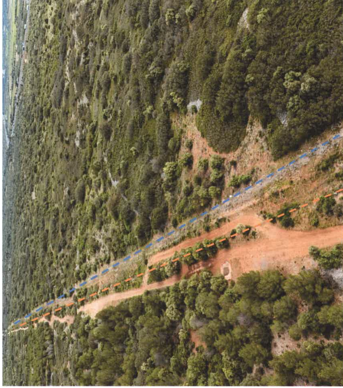
Figure 2 : Positionnement de l'ouvrage TEREQA (pointillés bleus) et de la fibre optique au sein des EBC de la commune

La vue aérienne ci-dessous illustre le positionnement de la fibre optique ORANGE (pointillés oranges) au sein du massif des Corbières et de la canalisation TEREQA (pointillés bleus).